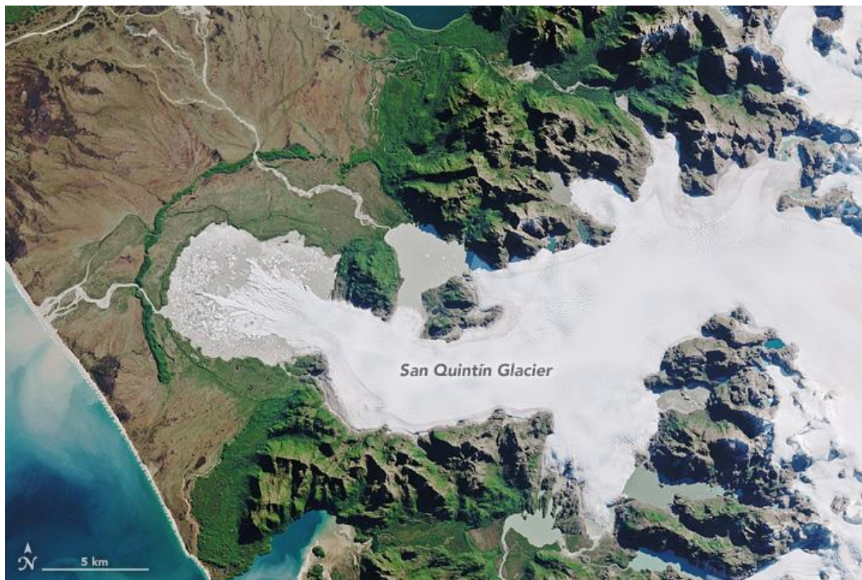
Ausschnitt einer Landsat 8-Szene des nördlichen Eisfeldes